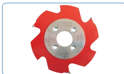
Fresa p/ Clamex P (Zeta) 100,9 x 7 x 22 mm cod.: 004240000225