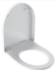
Imagem de exemplo